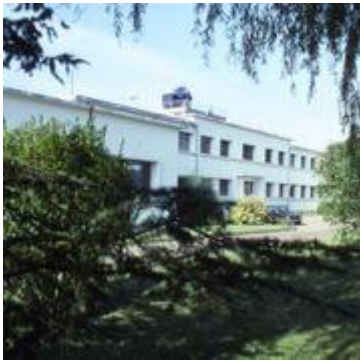
Centre Magny les Hameaux

Historique de Magny les Hameaux 1952 – 1993 Voir le diaporama