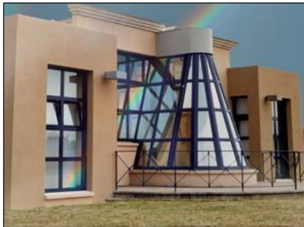
Claude Nano-Ascione souvenirs CDM 19 (Corrèze)