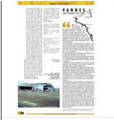
Jean-Paul Bénec'h souvenirs CDM56 - extrait de l'AEC 179.