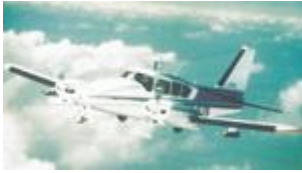
Centre d'aviation météorologique