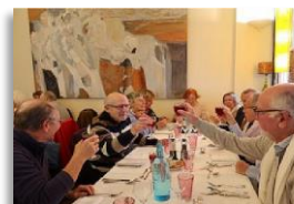
2023 : repas de fin d'année (délégation Île-de-France)