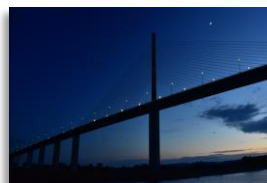
2022 : croisière sur la Seine, de Melun à Honfleur, sur le thème des impressionnistes