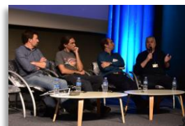
2024 : colloque « météo, santé et changement climatique en métropole et outre-mer »