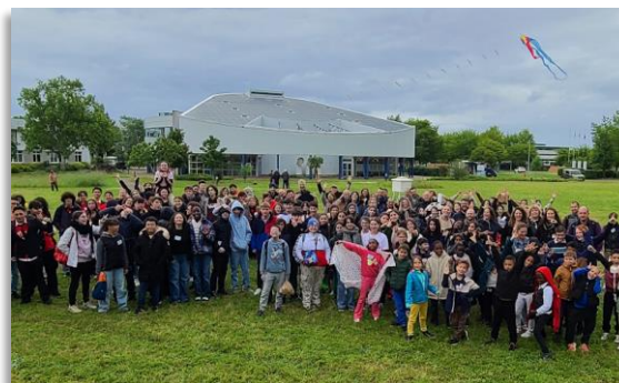
En 2024, les 150 élèves des Rencontres Météo et Espace sur la météopole

La cotisation annuelle à l'AAM est de 36 € en 2025. Les nouveaux adhérents à l'association sont dispensés de cotisation l'année civile de leur adhésion.