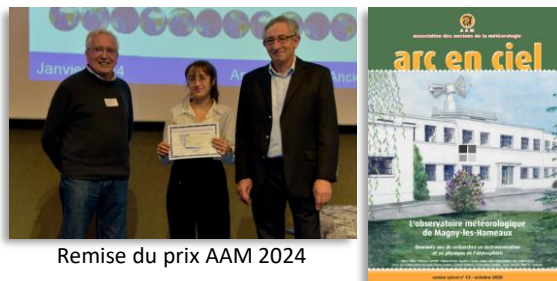
Remise du prix AAM 2024

Un(e) correspondant(e) social(e) informe les membres sur l'évolution de leurs droits et veille à accompagner les membres dans le besoin.