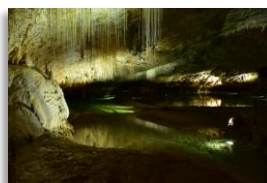
2022 : visite des grottes de Choranche (assemblée générale dans le Vercors)

Les voyages, les séjours associés aux assemblées générales, les rendez-vous régionaux sont autant d'occasions de créer de la convivialité et du lien social. D'autres types de rendez-vous sont envisagés, comme des petites randonnées ou des spectacles culturels. En 2023, année du centenaire de l'AAM, l'association a innové en organisant deux colloques et un concours de nouvelles. Ces initiatives seront poursuivies à raison d'un colloque par an et un concours tous les deux ans.