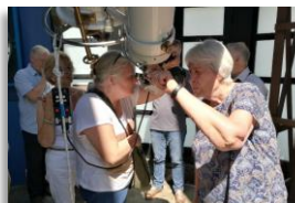
2023 : à l'observatoire de Lille (délégation Hauts-de-France)