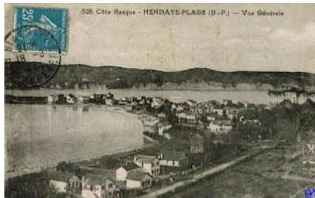
VUE GENERALE HENDAYE PLAGES 1927 PAYS BASQUE D'ANTAN

« Le climat est la résultante de deux séries de conditions bien différentes : les unes qu'on pourrait appeler des éléments fixes qui proviennent de : 1° la situation, 2° la topographie, 3° la constitution géologique du sol ; les autres les éléments mobiles que nous classerons ainsi : Vents, 2° Pluie et état hygrométrique, 3° Température et 4° Insolation. Quand ces éléments auront été étudiés nous pourrons en présenter une vue d'ensemble qui nous donnera une idée de l'aspect général des saisons dans notre station. Alors seulement nous poserons brièvement les conclusions qui se dégagent avec une indiscutable netteté. »