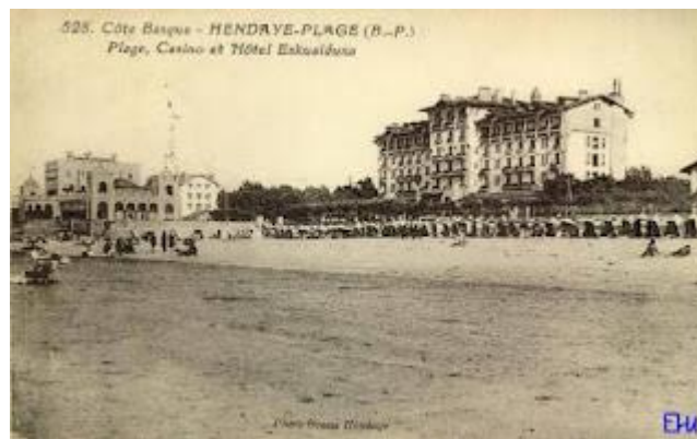
PLAGE CASINO ET HÔTEL ESQUALDUNA HENDAYE 1927

Hendaye-Plage est une presqu'île entre la baie et le bassin. C'est la seule station au nord-est de la Côte présentant une façade orientée au Sud vers une étendue marine. Nous en verrons toute l'importance pour l'insolation, si particulière à notre avis d' Hendaye-Plage .