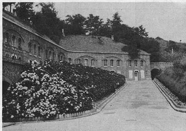
Une vue intérieure.

Nous décidons très délibérément ici de ne pas commenter ces photos à la valeur historique certaine. Selon notre principe solidement établi suivant lequel notre bulletin fonctionne un peu comme une «auberge espagnole», les lecteurs sont invités à nous transmettre leurs souvenirs. . . Tout sera publié. . .