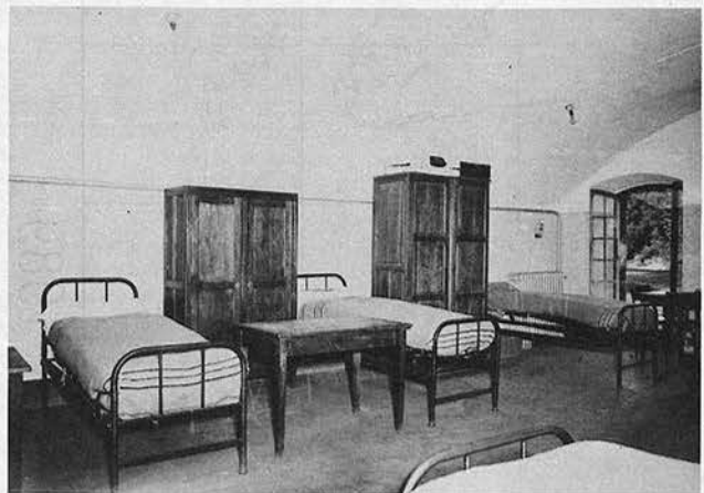
Une chambrée à la rigueur toute militaire.