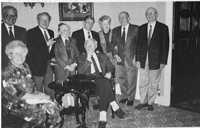
«Le groupe des dix» (moins la photographe : Mme CHAUSSARD). La bonne humeur règne...

Le circuit se termine à «La Frégate», un restaurant panoramique qui domine le port de St-Peter.