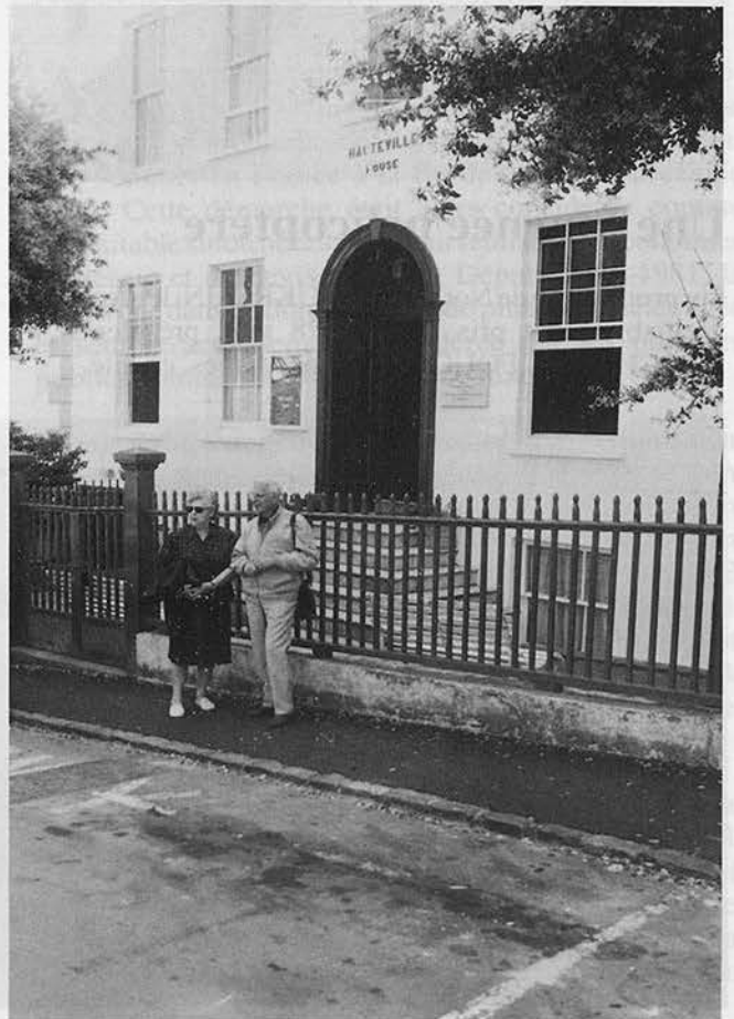
Le «couple présidentiel» devant la maison de V. HUGO

Quelques parties de bridge, un lèche-vitrine actif dans la zone piétonne de King Street ont complété ce séjour