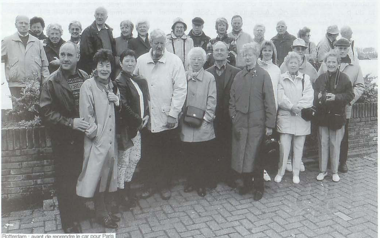
Rotterdam : avant de reprendre le car pour Paris