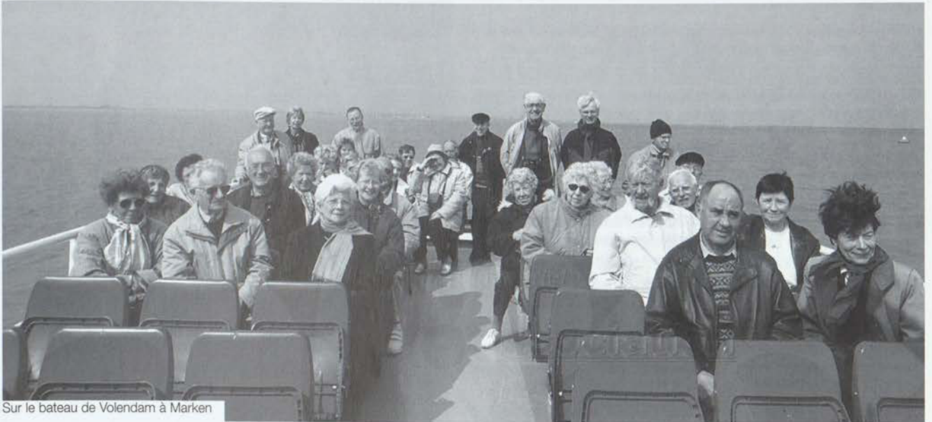
Sur le bateau de Volendam à Marken

exposent leur fromage en plein air ; les acheteurs ayant fait leur choix, des porteurs, tous habillés de blanc mais avec des coiffes de couleurs différentes, s'emparent des meules, les portent sur des «brancards» à la pesée, puis les ramènent à l'acheteur qui les charge sur une charrette. Dans un coin, un artisan fabrique des sabots, à la main.