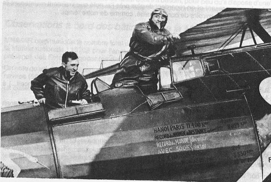
Prévisions météorologiques 31 août 1930